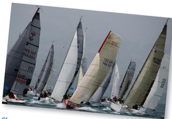
Chaque année, en juin, tu peux voir plus de 500 voiliers lors de la régata du Bol d'or.

C'est en Valais que se situe le parc éolien le plus haut d'Europe. Ces quatre éoliennes se trouvent à 2'465 mètres d'altitude, au col de Nufenen.