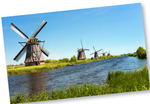
Certaines régions d'Europe, comme la Hollande et le Portugal, ont gardé une forte tradition de moulins à vent. Photo: Moulins à vent, Hollande – SergiyN, Shutterstock

Dans notre pays, le nombre d'éoliennes reste limité. En 2018, on compte 37 éoliennes installées en Suisse, totalisant 75 Mégawatts de puissance électrique. En 2017, elles ont produit 132 millions de kilowattheures (KWh). Cela permet d'alimenter 36'600 ménages en électricité. Cela ne représente toutefois que 0,2% de la consommation électrique de notre pays.